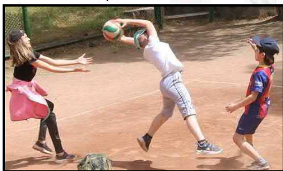
Один летает, остальные страхуют