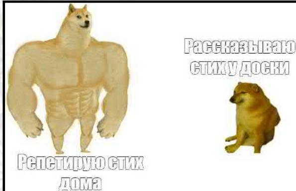
Ильмамбетов Рамин, 5 класс