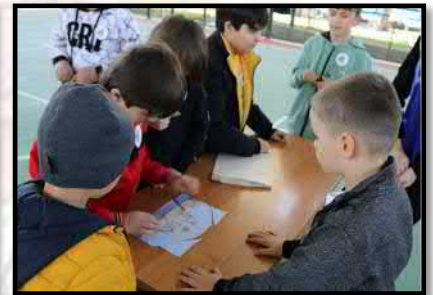
У нас есть мысль, и мы её думаем...