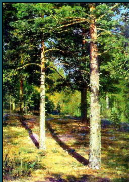
И.И. Шишкин, «Сосны, освещённые солнцем»

«Даже автомашины не надо. Придумать другой, старинный способ путешествовать. Взять корзину с сэндвичами, три бутылки шипучки, и впереди нескончаемое лето...» –