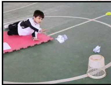
Учимся бросать мусор в урну метать гранату